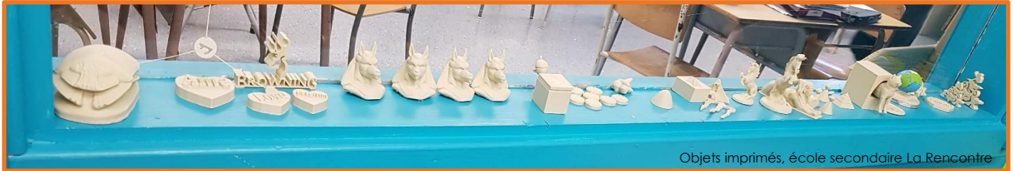
Objets imprimés, école secondaire La Rencontre