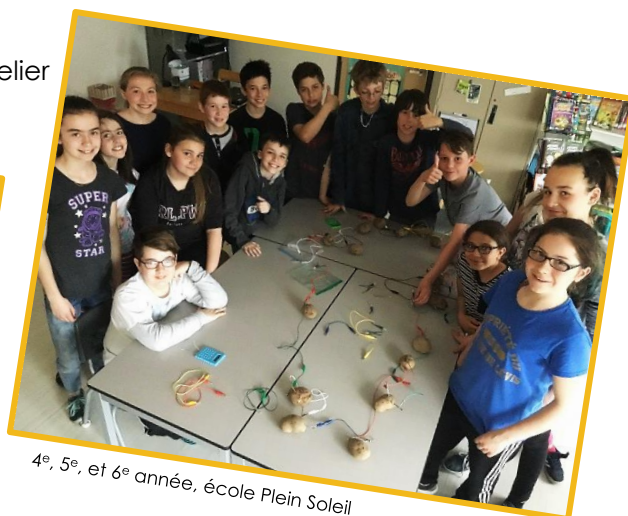
4 e , 5 e , et 6 e année, école Plein Soleil