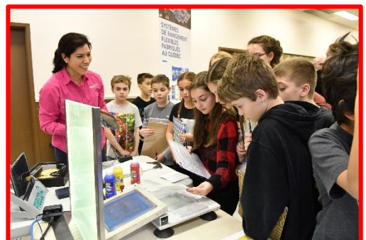
Kiosque de Prelco, journée Accro de la Techno 2017