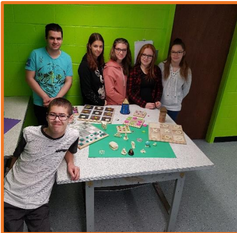
Élèves et leurs projets, école secondaire La Rencontre

L'impression 3D crée un réel engouement. Suite aux emprunts, l'école Bon Pasteur et l'école St-Pie-X ont fait l'acquisition d'une imprimante 3D et une autre école planifie le faire.