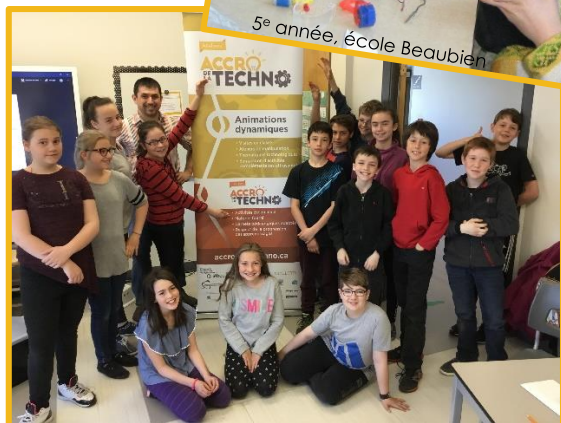
4 e , 5 e , et 6 e année, école Plein Soleil

« Je n'ai que des commentaires positifs à vous faire. Des démonstrations intéressantes, des explications adaptées à leur niveau, du matériel de manipulation stimulant... Les enfants étaient vraiment heureux de leur après-midi!! Merci »